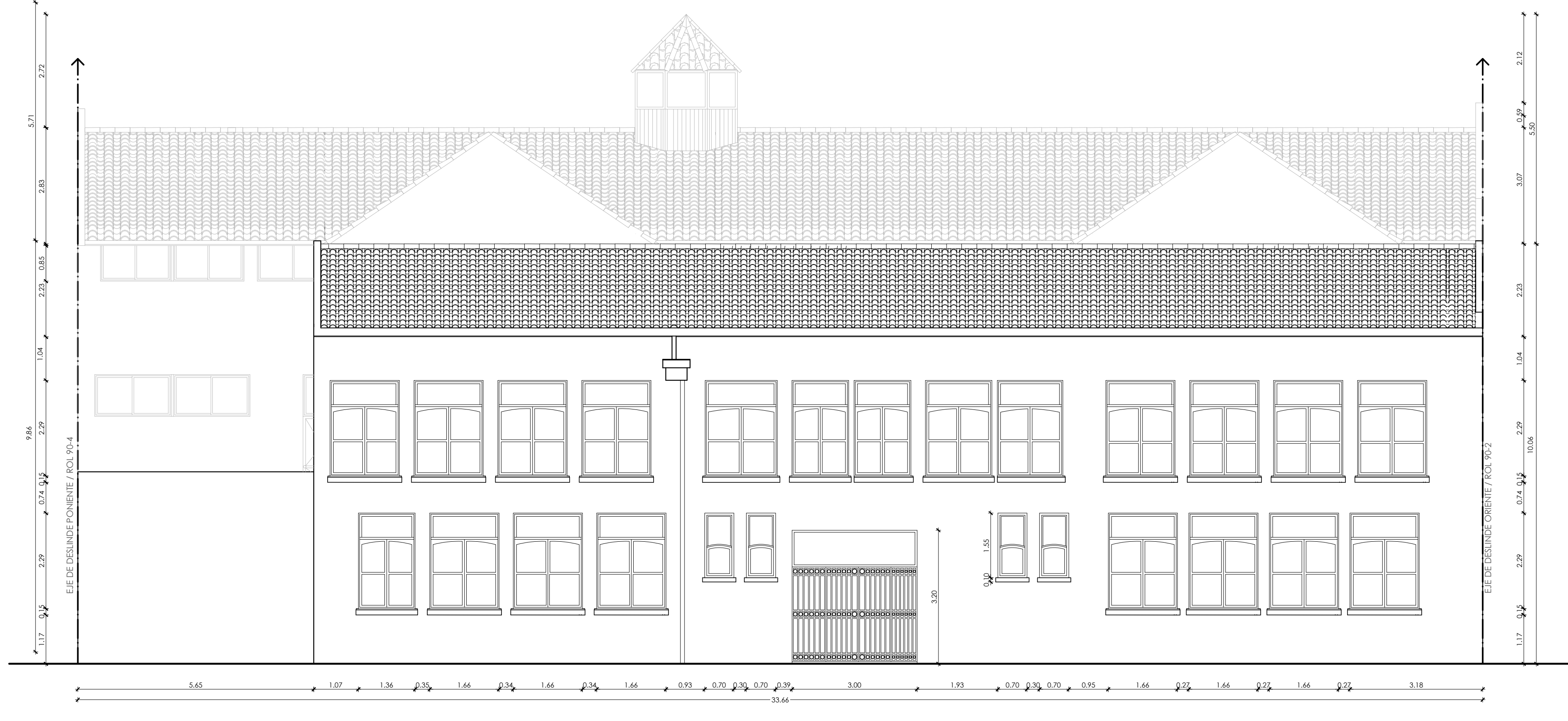
ELEVACIÓN POSTERIOR ESCALA 1/75