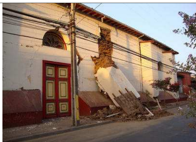
iglesia de la Merced

También quedaron dañados algunos monumentos históricos como, la Iglesia Catedral, Iglesia La Merced y la Casa de la Cultura, entre otros