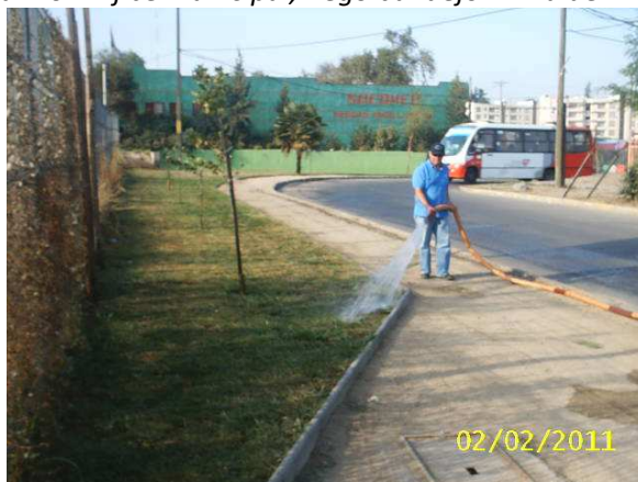
Camión aljibe municipal, riego bandejón Viña del Mar