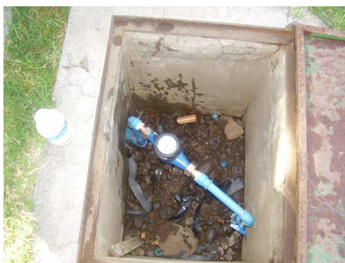
Reposición de medidores