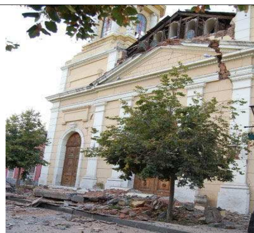
Catedral de Rancagua