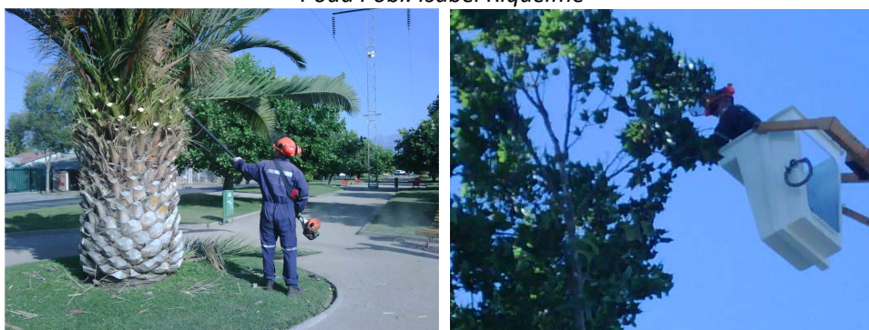
Podas (1), con Capacho