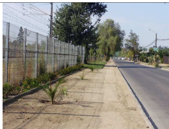
Bandejón lateral poniente Av. Viña del Mar.