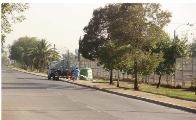
Camión Aljibe municipal, riego bandejón Viña del Mar