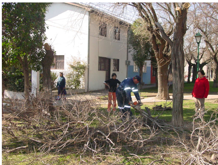
Poda Pobl. Isabel Riquelme