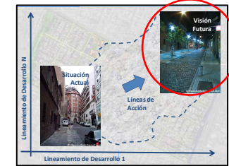
Imagen Objetivo de Rancagua Contenidos: Visión Futura